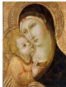
聖母子像 [サノ・ディ・ピエトロ]

カトリック教会では、5月は 聖母月 としています。 聖母月 の信心は近世からのもので、18世紀のイタリアで盛んとなりました。この5月は、四季折々の中で春の訪れとともに自然界の実りをもっとも感じさせてくれ、また主の復活の喜びと希望に満ちた月でもあります。そのような思いをもってこの月をマリアにささげ、マリア崇敬のために祈り続ける信心が伝統としてなされてきました。(以上カトリック協議会HPより)