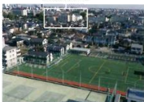
南小泉総合グラウンド(一本杉キャンパスより徒歩5分)